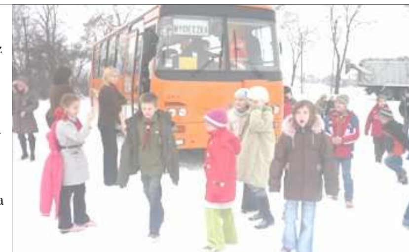
Uczestnicy wyjazdu po światelko betlejemskie

Uroczyste przekazanie nastąpiło o godzinie 16.00 na placu apelowym na Wawelu. Całe środowisko harcerskie udało się do Bazyliki Mariackiej na Mszę Świętą, po której odbyło się spotkanie opłatkowe i zawiązanie kręgu przyjaźni.