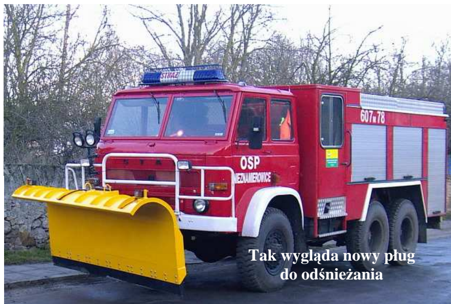
Tak wygląda nowy pług do odśnieżania

Na początku grudnia 2007 r. został zakupiony pług do odśnieżania i został zamontowany do samochodu strażackiego marki Star 266 z OSP Nieznamierowice. Jednostka będzie nieodpłatnie odśnieżać drogi na terenie naszej gminy. Tel pogotowia śnieżnego — 889 597 038