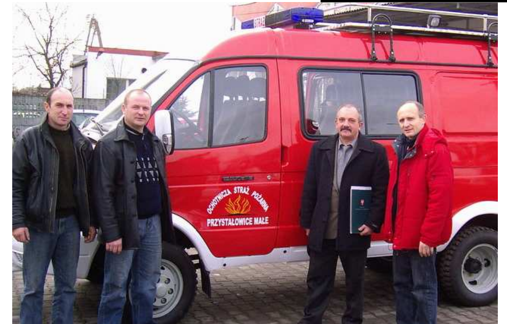
Odbiór nowego samochodu ratowniczo - gaśniczego dla OSP Przysiałowice Małe. Koszt pojazdu wraz z wyposażeniem wyniósł 126.260zł. Zakup został dofinansowany kwotą 94.700zł. przez Urząd Marszałkowski Województwa Mazowieckiego.

31 grudnia 2007r. jest ostatnim dniem w którym można złożyć wniosek o wymianę dowodu osobistego.