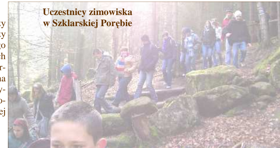
Uczestnicy zimowiska w Szklarskiej Porębie

Większość tych dzieci po raz pierwszy w życiu pojechała w góry, po raz pierwszy w ogóle wyjechała poza miejsce swojego zamieszkania. Podczas zorganizowanych ferii zimowych uczyły się jeździć na nartach, zjeżdżały na sankach, chodziły na długie wycieczki wzdłuż górskich szczytów - jednym słowem wypoczywały i doskonale się bawiły w prawdziwie zimowej scenerii.