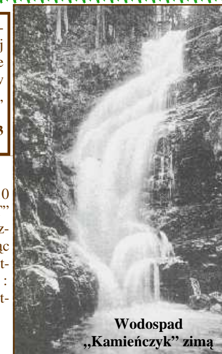
Wodospad „Kamieńczyk” zimą